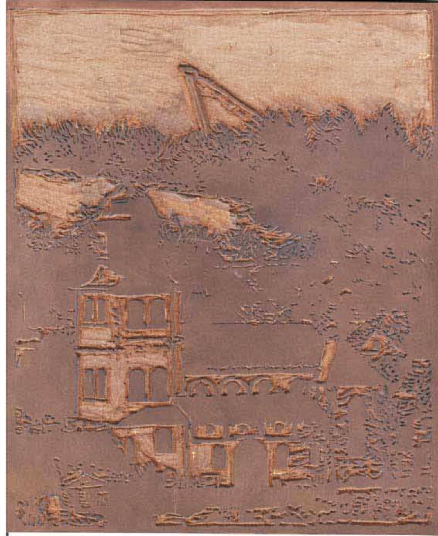
Der fertige Schnitt auf der Linolplatte